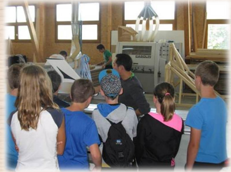
Visite de la MFR des métiers du bois