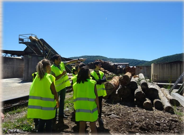
Visite d'une scierie

La recherche s'effectue sur des critères géographiques et/ou par type d'entreprise (travaux forestiers, scieries, charpentiers, menuisiers, constructeurs, tourneurs sur bois, ébénistes..) en fonction des souhaits exprimés par le collège.