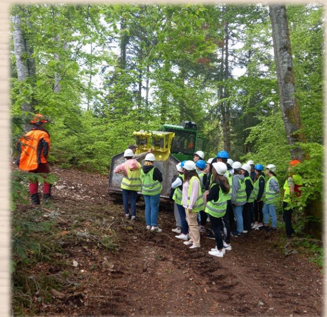
Visite d'un chantier forestier