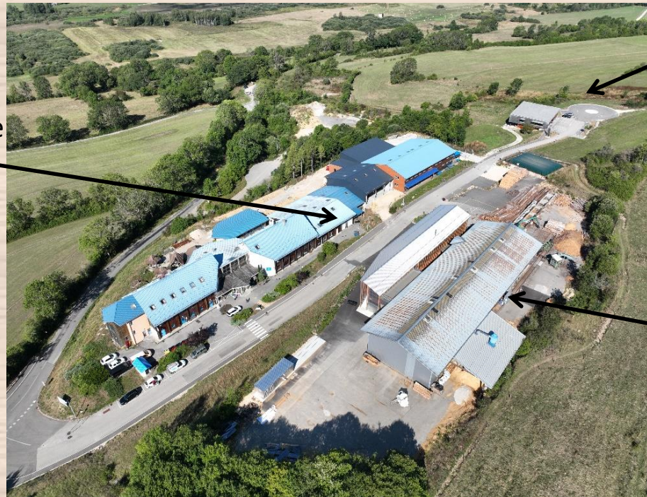
MFR : Maison Familiale Rurale