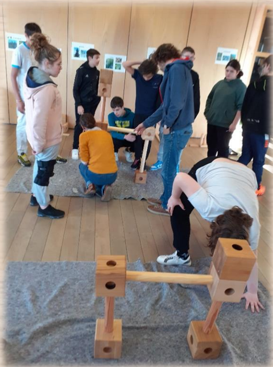
Grand jeu en bois de découverte des essences locales