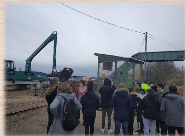
Visite de l'Ecole Technique du Bois