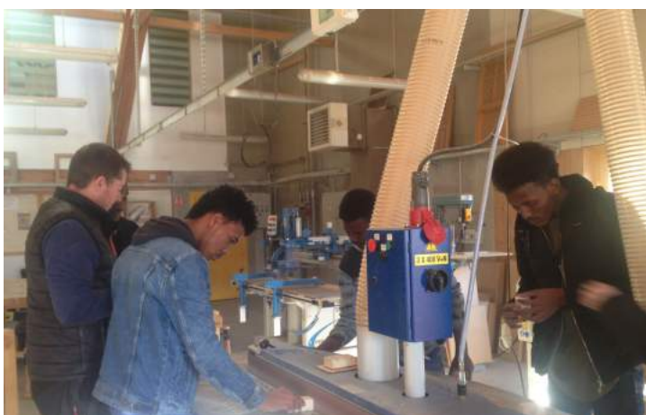
Visite de la MFR pour les candidats primo-arrivants

Menuiserie et agencement : la réalisation d'un annuaire des menuisiers fabricants bois de l'Ain en 2019 avait permis à FIBOIS 01 d'identifier de réelles difficultés de recrutement dans ce domaine. Face à ce constat, l'interprofession a initié en 2020 une réflexion collective en faveur de la mise en place de deux parcours de formation (menuisier fabricant / agenceur) composés de modules courts et associant plusieurs centres de formation de l'Ain. Ces parcours seraient destinés à la fois aux demandeurs d'emploi désireux de se reconverter dans le secteur menuiserie/agencement et aux salariés déjà en poste dans les entreprises et souhaitant parfaire certaines compétences. Deux groupes de travail, coordonnés par FIBOIS 01 et composés de représentants d'entreprises et de centres de formation, se mettront en place à la rentrée 2020 en vue de concrétiser cette action de formation.