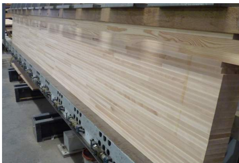
Visite de l'entreprise La Bourguignonne (71) Fabrication de lamellé-collé en hêtre du Poizat-Lalleyriat (Scierie Pépin)