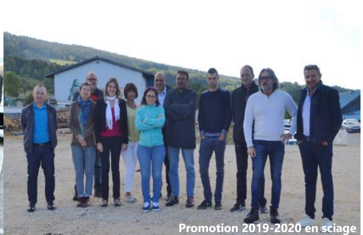
Promotion 2019-2020 en sciage

Métiers du sciage : formation professionnalisante de 400 heures de septembre à décembre 2019 à l'ETB de Cormaranche-en-Bugey. 6 stagiaires ont été formés. L'action, menée à l'échelle régionale, a également permis de former 6 stagiaires au CFA d'Ambert (63). La moitié des stagiaires formés travaille aujourd'hui dans le secteur du sciage. FIBOIS 01 et l'ensemble du réseau FIBOIS en AuRA ont impulsé cette action de formation et se sont fortement mobilisés en faveur de sa réalisation : vaste campagne de communication sur les métiers de la scierie (radio, TV, presse écrite), recherche de candidats, suivi des stages en entreprises, bilan de la formation. Action menée en partenariat avec le CFPPA Savoie Bugey, l'ETB, le CFA d'Ambert, le Pôle Emploi et les entreprises avec le soutien de la Région AuRA et du Département de l'Ain.