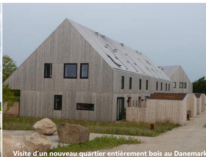
Visite d'un nouveau quartier entièrement bois au Danemark