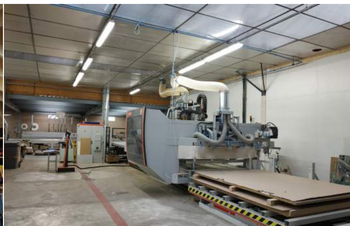
Atelier d'agencement de l'entreprise Mobilier Bois Design