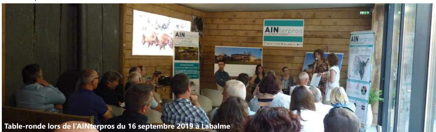
Table-ronde lors de l'AINterpros du 16 septembre 2019 à Labalme