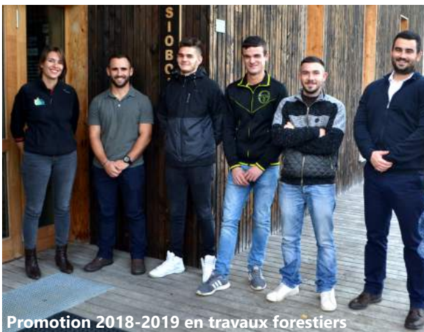
Promotion 2018-2019 en travaux forestiers

Métiers de l'exploitation forestière : à partir du printemps 2020, relance de la communication sur les formations diplômantes et professionnalisantes Travaux Forestiers à VisioBois auprès des prescripteurs de l'emploi et du grand public. Réception des candidatures et recherche de stages dans les entreprises. La reprise des formations est prévue à l'automne 2020. Action menée en partenariat avec le CFPPA Savoie Bugey, la Charte Forestière du Bugey, le Pôle Emploi et les ETF de l'Ain avec le soutien de la Région AuRA et du Département de l'Ain.