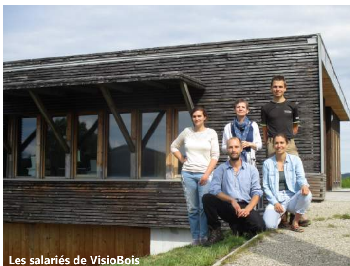
Les salariés de VisioBois

Depuis 2020, un réaménagement des espaces intérieurs a commencé : évacuation des encombrants, réorganisation de l'espace pour le rendre plus accueillant et plus fonctionnel. Du mobilier sur-mesure sera commandé pour compléter ce réaménagement avec notamment la création d'une matériauthèque et d'un meuble de présentation des revues et documents à disposition.