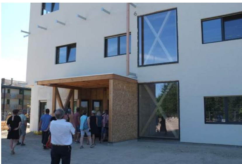
Visite du Lycée St Joseph de St-Didier-sur-Chalaronne menuiseries bois/alu en chêne rouge de la Dombes (Menuiseries Philibert - Scierie Pépin)

Avec de nombreuses plantations en cours, l'action autour du chêne rouge se poursuit. En juillet 2019, un groupe de professionnels comprenant scieurs de feuillus et menuisiers a ainsi visité l'entreprise La Bourguignonne dans le 71, entreprise de fabrication de carrelets. Cette visite aura permis la fabrication de carrelets lamellé-collé de chêne rouge, notamment pour le projet du Lycée St Joseph à St Didier sur Chalaronne. En 2020, le projet de construction de l'usine des cafés Dagobert à Châtillon-sur-Chalaronne comprendra lui aussi du chêne rouge de la Dombes.