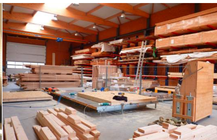
Préfabrication d'une ossature bois à l'entreprise Girod-Moretti