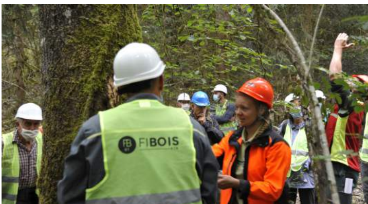
Visites en forêt de Seillon le 27 août et en forêt d'Hauteville le 28 août