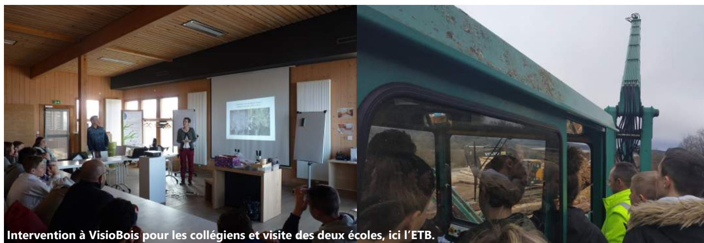
Intervention à VisioBois pour les collégiens et visite des deux écoles, ici l'ETB.

Collège d'Hauteville-Lompnes – février 2020 – 70 élèves