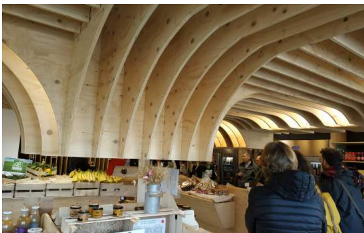
Epicerie Basse-cour et Potager lauréate du prix régional et national de la construction bois