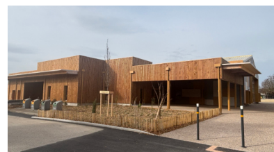
Salle des fêtes Saint-Denis-lès-Bourg entièrement restructurée Architectes Jacques GERBE et Aurélie KLEINE

Venez partager ce moment avec nous et (re)découvrir l'évolution du bâtiment durable de 2015 à 2025 et ouvrir des perspectives pour les 10 ans à venir.