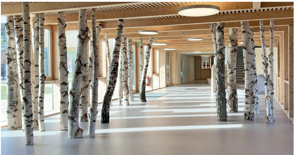
Ecole des collines / DESIGN & ARCHITECTURE et NAMA ARCHITECTURE