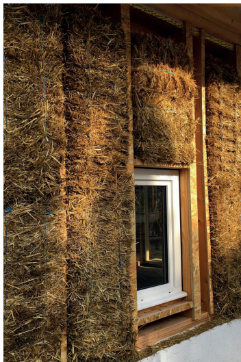
Alsh de Vinsobres / ATELIER D'ARCHITECTURE UGO NOCERA et ATELIER NAO